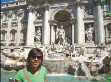
Fuente Trevi, Roma, Italia