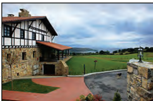
Casa rural Larrakoetxea, Plentzia, Vizcaya, País Vasco, (España)

http://www.flickr.com/search/?q=País+Vasco