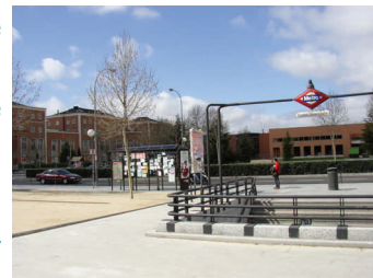
Parada del metro en el campus de ciudad universitaria