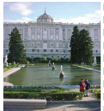
Palacio Real de España, ubicado en el centro de Madrid.