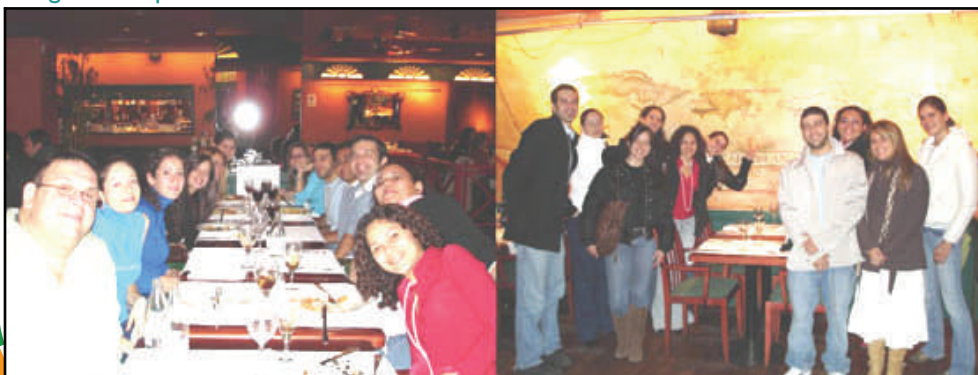
Los directores de CoHemis y los estudiantes durante cena en el restaurante Rodi Caribe en Madrid

Informe del viaje a España de los directores de CoHemis, febrero 2006.