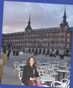
Plaza Mayor, España