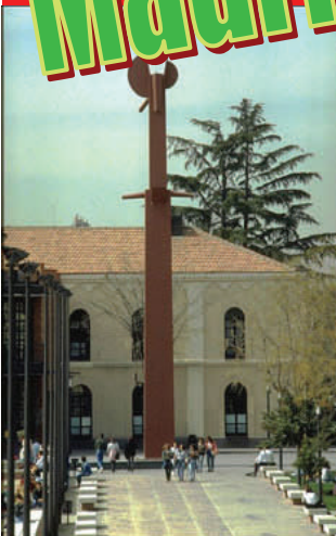
Patio de las Promociones, Facultad de Ciencias Sociales y Jurídicas.