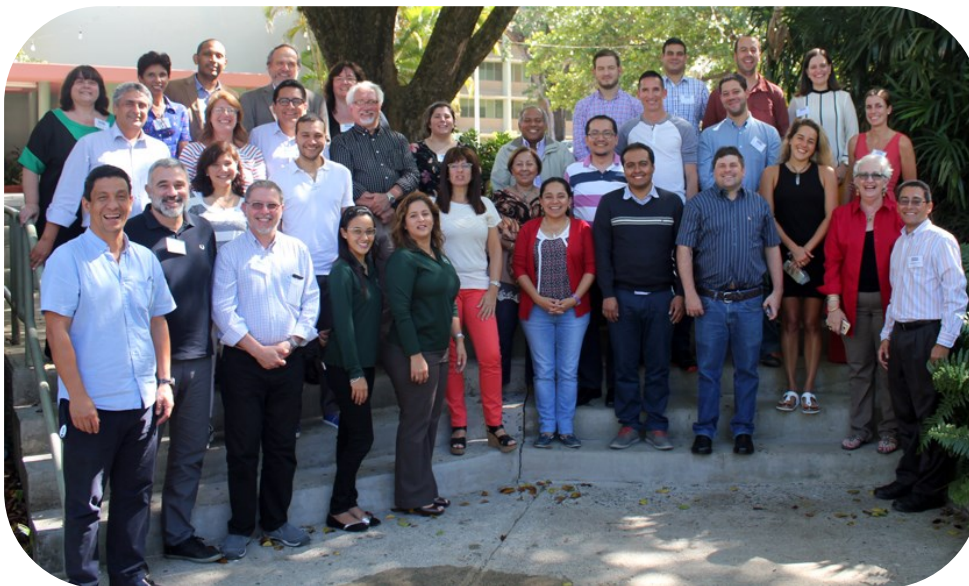
Un grupo de 26 académicos, proveniente de distintas partes de Latinoamérica y España, acudió al encuentro, motivado por formarse y desarrollar estrategias de enseñanza, en las que se implemente la tecnología para crear un ambiente que fomente el aprendizaje y al que se le pueda dar seguimiento.

Según informó, una de las innovaciones que pretenden implementar es que cada tres años los profesores de ingeniería vayan a la industria, tal como ocurre en China. Otros cambios van encaminados a promover el interés de los alumnos, libre de distracciones y que incluya estrategias de evaluación continua.