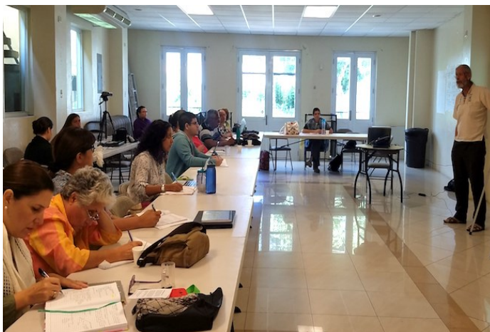
La jornada que transcurrió del 5 al 9 de junio, en el salón de reuniones de la Unión de Trabajadores de la Industria Eléctrica y Riego (Utier).

"Hemos compartido procesos de trabajo con las comunidades, con cooperativas, con movimientos sindicales y ambientales, donde las metodologías participativas pasan a ser desde unos 20 a 30 años, fundamentales para darle, por un lado más operatividad y más práctica a las ciencias sociales y las naturales, y también más base científica cuantitativa, cualitativa y de control y de consenso con la comunidad. Cumplimos así uno de los