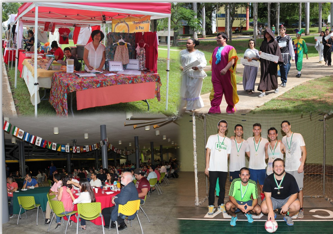
La Semana Internacional en el RUM 2014 incluyó la participación de artesanos internacionales, el aspecto literario internacional con la participación del Proyecto Arte Escénico Colegial (PAEC), la tradicional cena internacional, y un torneo de soccer.

Cultura, artesanías, deporte, baile, arte culinario y teatro, fueron algunos de los aspectos sobre los que giró la Semana Internacional que desde hace cuatro años se realiza en el Recinto Universitario de Mayagüez (RUM) de la Universidad de Puerto Rico (UPR).