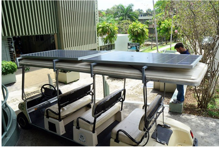
El carro de golf eléctrico causó mucho impacto en el público.

Con el objetivo de crear conciencia sobre lo que el ser humano puede causar al medioambiente y los procesos que deben utilizarse para enfrentar el cambio global, la organización Campus Verde Colegial del Recinto Universitario de Mayagüez (RUM) celebró, la sexta edición de la Semana del Planeta desde el 22 hasta el 26 de abril.