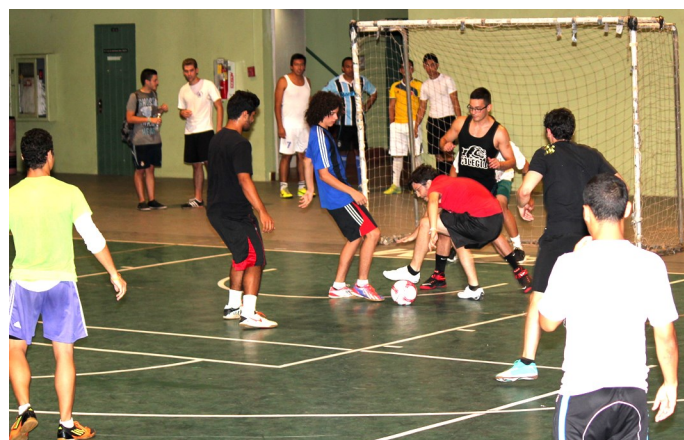
Varios equipos con estudiantes de diferentes países participaron del tan esperado torneo de soccer, celebrado en el gimnasio del RUM.