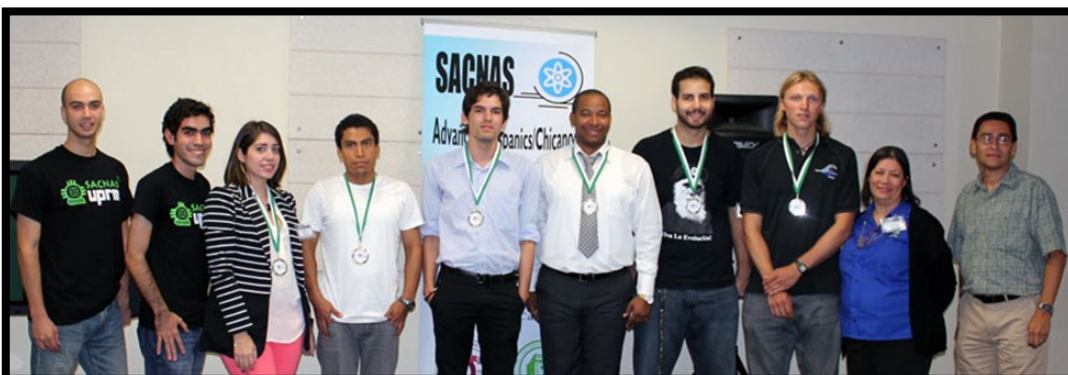
Capítulo de SACNAS-UPRM celebrando por segundo año consecutivo su simposio de ciencia y tecnología.

El capítulo de SACNAS-UPRM celebró por segundo año consecutivo su simposio de ciencia y tecnología. Este grupo estudiantil ligado a CoHemis, y el cual ha ganado múltiples premios nacionales por sus grandes ejecutorias, hizo un llamado a los estudiantes universitarios de todo Puerto Rico a presentar sus trabajos de investigación de forma oral o en afiche. La actividad se llevó a cabo el 24 y 25 de abril de 2014 en el Edificio Celis de nuestro recinto y estuvo abierta a todas las áreas de ingeniería y ciencias naturales. La cantidad y calidad de los trabajos sometidos fue excepcional y quedó demostrada la necesidad de expandir el tiempo y espacio de futuros simposios.