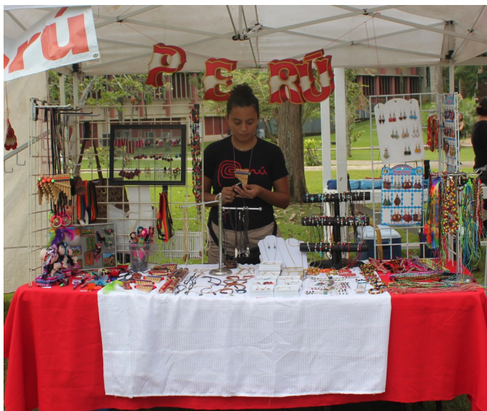
La “Plaza Internacional” tuvo un despliegue de artesanías representativas, entre otros, de Perú, México, Colombia y Puerto Rico.