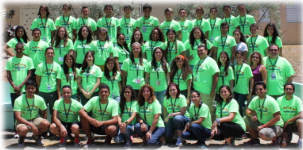
Durante siete días, 36 estudiantes provenientes de 19 escuelas de Puerto Rico, participaron del Campamento BETTeR-IC+ 2014.