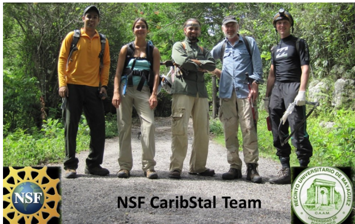
Equipo realizando trabajo geológico en el campo.

Desde siempre me han interesado las interacciones y cambios del sistema terrestre, razón por la cual decidí estudiar ciencias marinas en el Recinto Universitario de Mayagüez (RUM). Además, aquí tengo la oportunidad de usar isótopos estables para investigar cambios climáticos. Tomé seis años de español en mi escuela superior y quería mejorar ese idioma. Esa fue una de las razones que me llevaron a escoger el RUM entre tantas universidades en el mundo para realizar estudios, además de adquirir la experiencia de estudiar en el sistema universitario de Estados Unidos. Por otro lado, quería escapar de la nieve de Alemania y disfrutar del clima tropical de Puerto Rico. Sin olvidar mencionar que también anhelaba practicar el ciclismo.