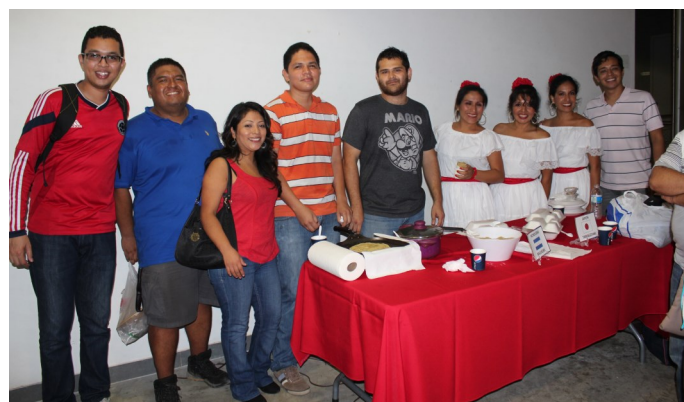
Algunos de los participantes de la Cena Internacional, en la cual tuvimos diferentes platos típicos y bailes folclóricos.