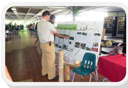
La actividad constituyó un espacio para presentar propuestas en pro del ambiente.

Por último, otro proyecto que fue de mucho impacto para el público que se dio cita en el tercer piso del Centro de Estudiantes, fue el carro de golf eléctrico perteneciente a Ingeniería Eléctrica y Computadoras.