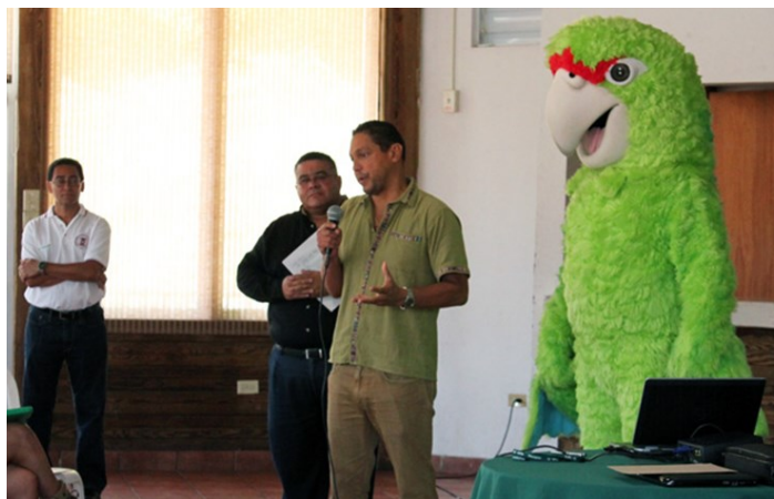
La Casa Abierta incluyó conferencias, exposiciones y una exhibición de la cotorra puertorriqueña, una de las especies de aves más amenazadas del mundo.