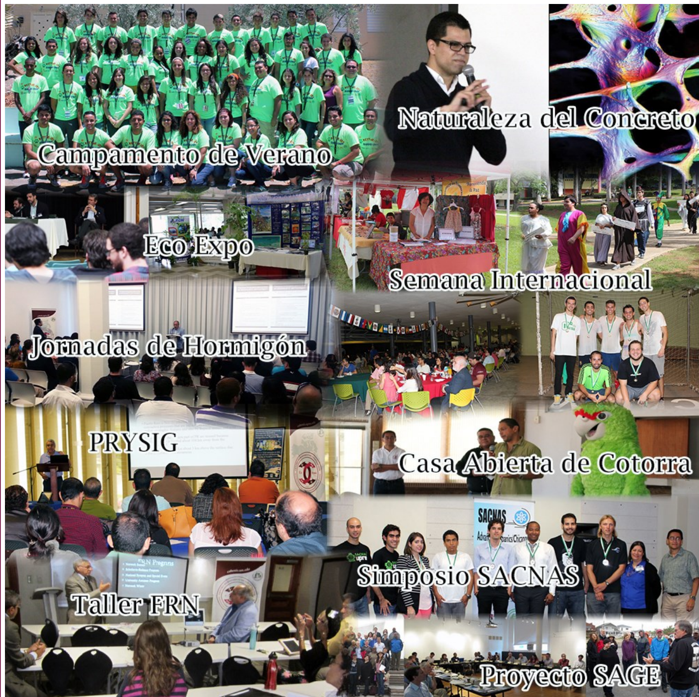
Campamento de Verano